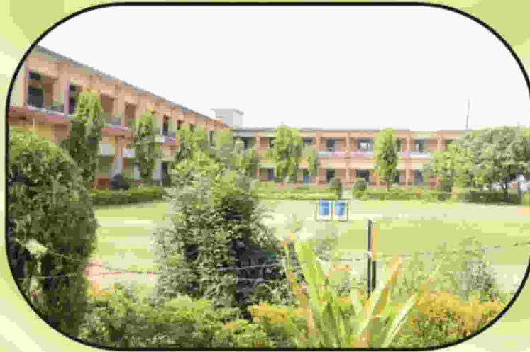
बी. टी.सी. विभाग एवं लॉन