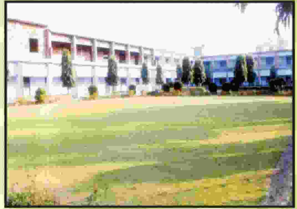
बी.एड. विभाग एवं लॉन