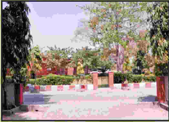
बी.पी.एड. विभाग एवं लॉन