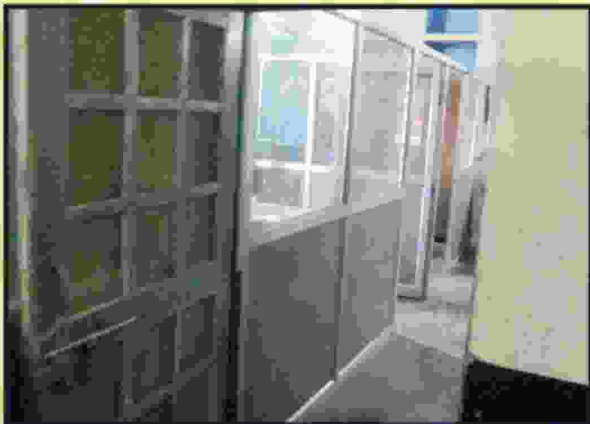
इन्टरनेट ऑनलाइन ऑफिस